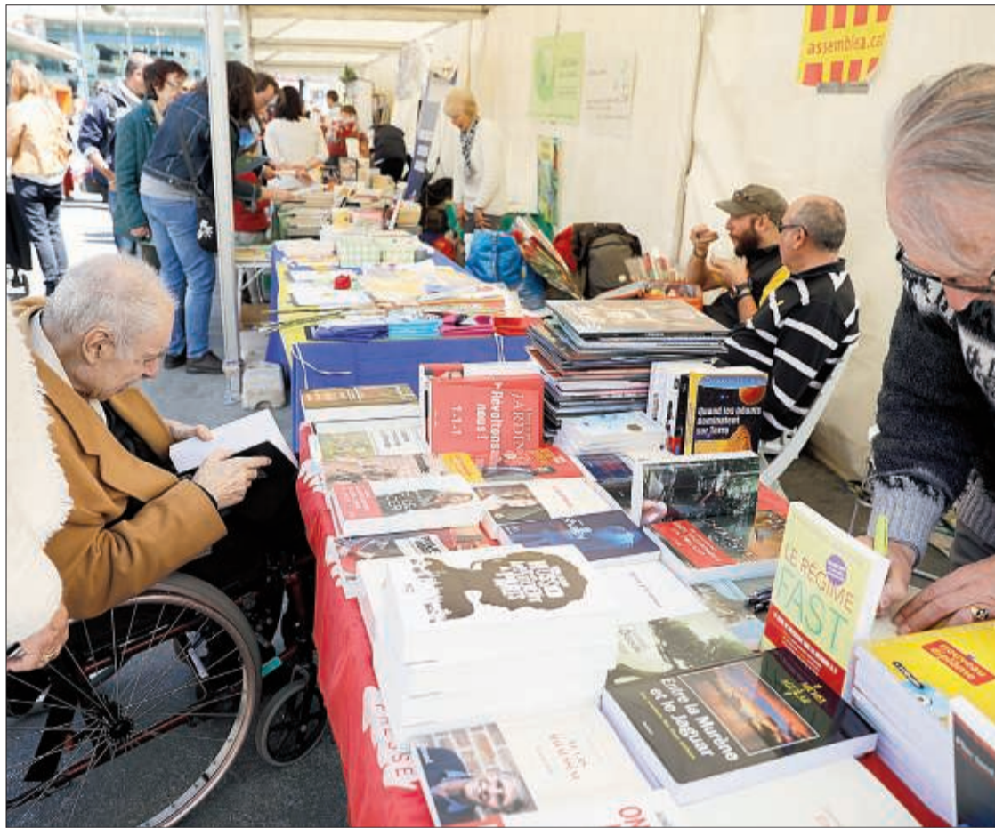
Encara queden sis setmanes per a la gran festa del llibre.